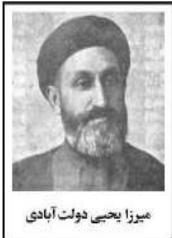
میرزا یحیی دولت‌آبادی

دولت‌آبادی در سال ۱۲۸۷ ش به تهران آمد و در چند دوره به نمایندگی مجلس شورای ملی انتخاب شد وی مسافرت‌هایی به کشورهای اروپایی داشت. در تهران به سکنه قلبی درگذشت. زنده یاد یحیی دولت‌آبادی شاعر و نویسنده و از پیشقدمان فرهنگ نوین در ایران و مؤسس مدرسه‌سادات. وی از جمله یکی از مشهورترین رجال سیاسی عصر مشروطه و دوران پس از آن تا اوایل حکومت رضا شاه به شمار می‌آید.»